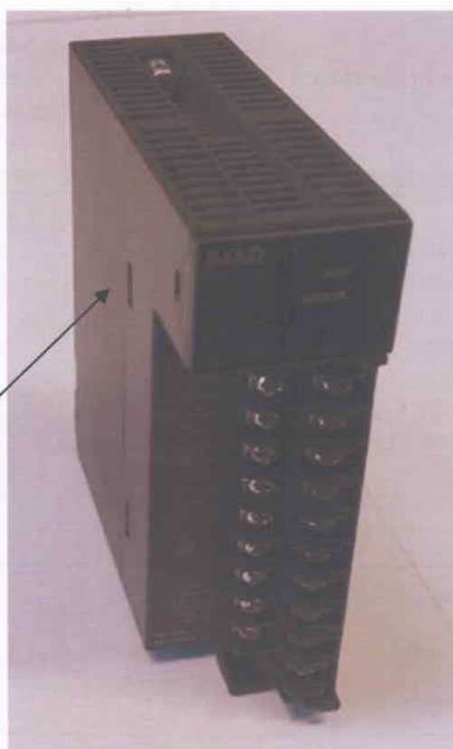
Рисунок 3 - Общий вид модулей ввода/вывода сигналов и место нанесения знака поверки