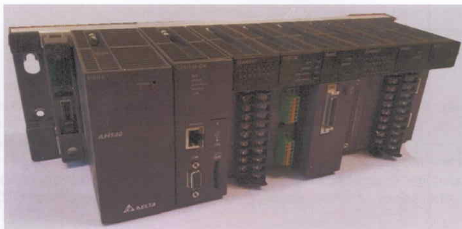
Рисунок 1 - Общий вид контроллеров в сборе

Общий вид модулей ввода/вывода сигналов и место нанесения знака поверки представлен на рисунке 3.